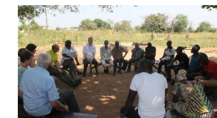
Sitzung beider Partnerschaftskomitees